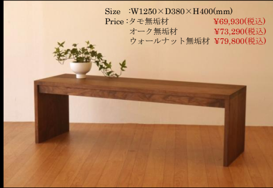
2 Leg Model

Size :W1250×D380×H400(mm) Price :タモ無垢材 ¥69,930(税込) オーク無垢材 ¥73,290(税込) ウォールナット無垢材 ¥79,800(税込)