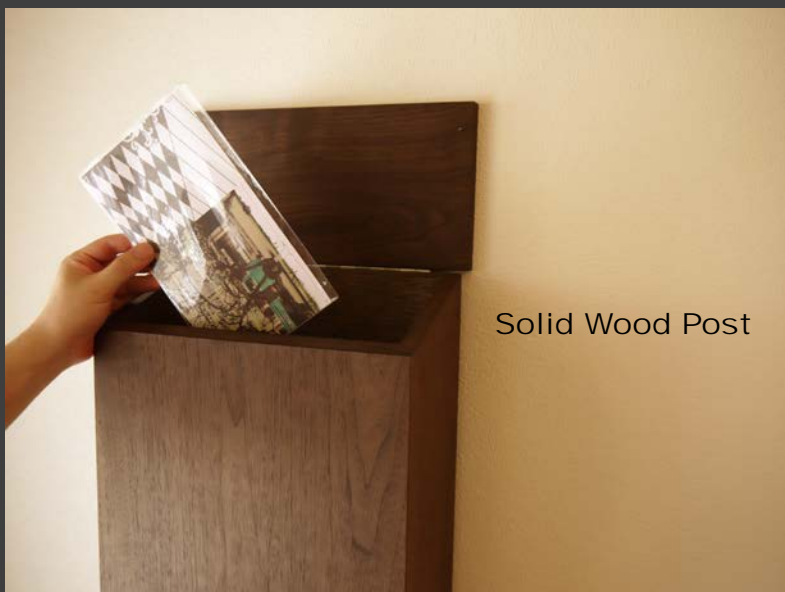
Solid Wood Post

ミヤモト家具では、上記のような屋外用の木製ポストをお作りできます。表面にはコーティングを施さず、屋外用のエクステリアオイルで仕上げることで、無垢材特有の風合いを存分に楽しめます。ポストは一家に一台、一生に一回のお買い物です。デザイン・サイズ・仕様はご希望に合わせてお作りいたしますので、「こだわりのポスト」ぜひ、作ってみてはいかがでしょうか。