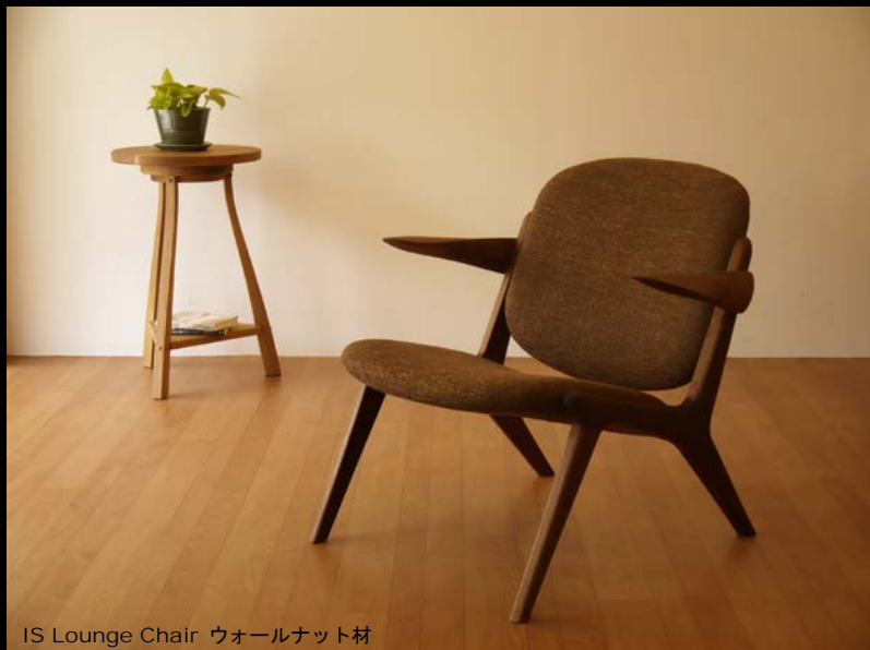
IS Lounge Chair ウォールナット材

『人の体はすべて曲線で出来ている。故にそれを包む椅子も曲線であるべきだ』 という考えのもとデザインされたラウンジチェア。機械と手作業の加工により削り出された有機的なフォルムのアームが象徴的で、その他のパーツもすべて曲線で構成されています。デザイナーと職人の高度な技術が生み出した珠玉の一脚です。