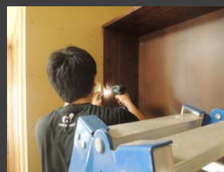
▲取り付け作業の様子