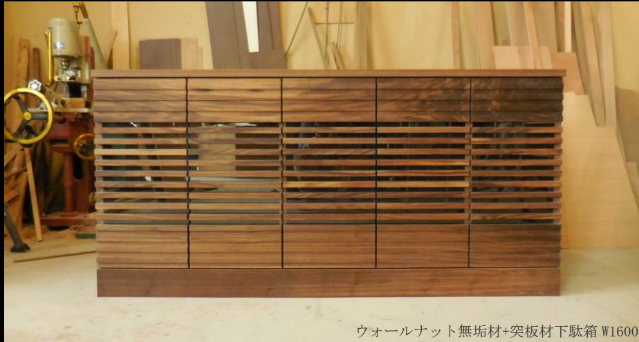
ウォールナット無垢材+突板材下駄箱 W1600