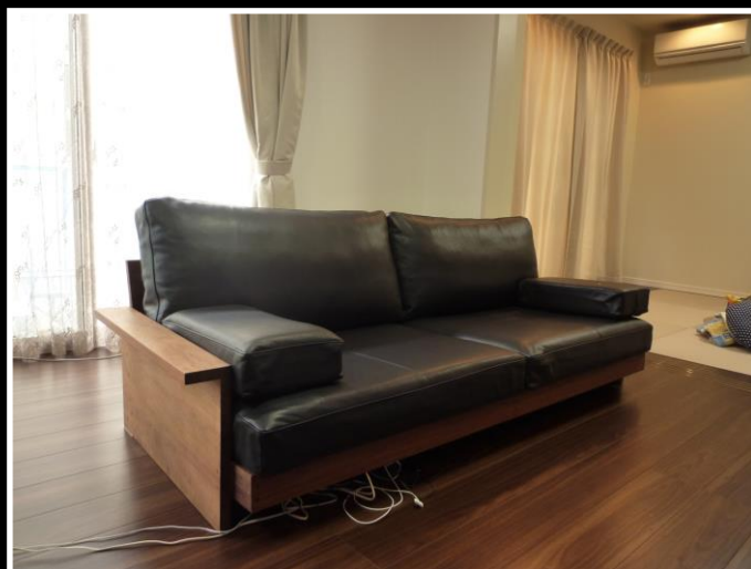
中身はそのままにカバーだけを買って替えるだけで新品のようによみがえりました。今度はツメががかりにくいレザーにしたことでお部屋の雰囲気もガラリと変わりました!