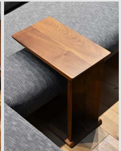
単独でも、ソファに挟み込んでも使える 万能なサイドテーブル