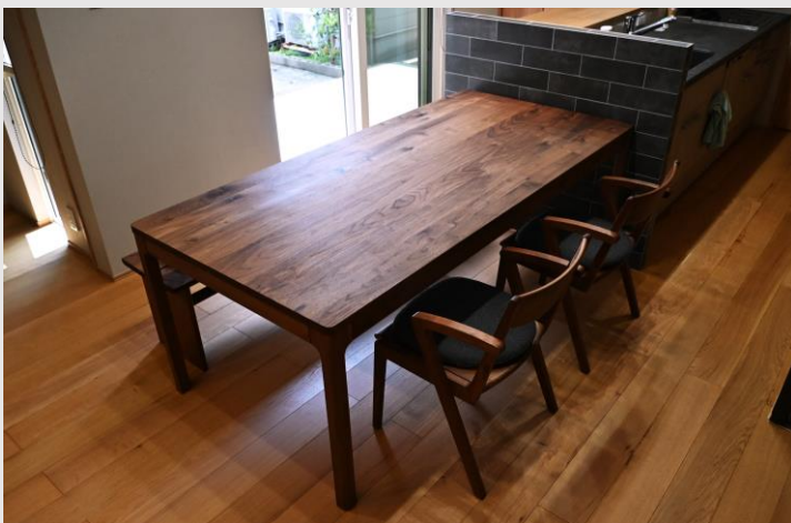
足し算ではなく、引き算から生まれたデザイン。 脚間が広く、ゆったりとした椅子の配置が可能に