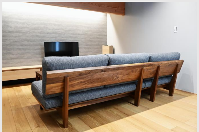
ソファはSOLIDのロングセラー。SLC-02モデル。迫力のある背面無垢の質感

A. 1番最初に決めたのがソファで、 無垢材をふんだんに使った見た目は勿論、サイズが詳細に調整できる所 や、胡坐をかいた時の座りが良かった。テーブルも、本当は1枚板のテーブルを予約までしていましたし、脚も4本脚では無くセンター脚の物に拘って見ていました。今購入した物とは、もはや180度違うデザインの物を他社で購入するつもりでいました。でもよくよく将来的な事まで考えた時に、使い勝手の部分や、他では見ない、 無垢材の存在感もありながらも、それでいてスッキリとしたデザイン性 に、最終的には惹かれる形となりました。予約していた1枚板のテーブルをキャンセルしてまで、選ぶ価値があると思いました。