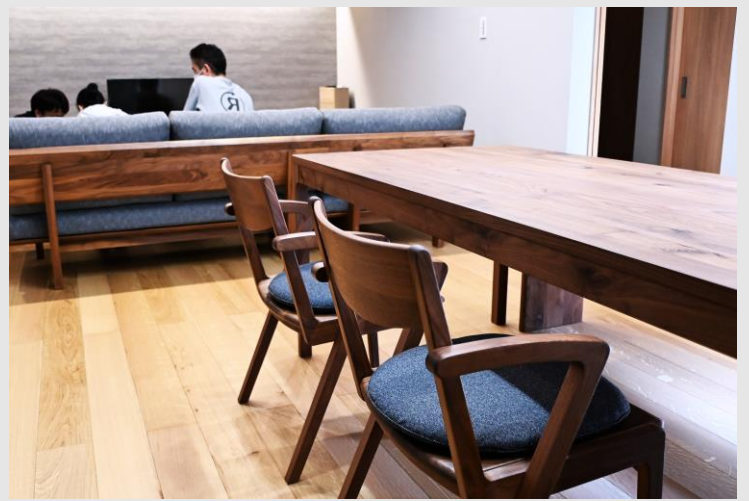
椅子はSOLIDより、座り心地抜群のショートアームをセレクト