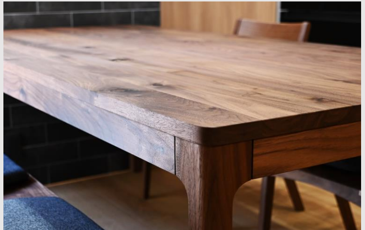
同デザインで統一したダイニングとリビングの脚部は、無垢材削り出しの上品なフォルム